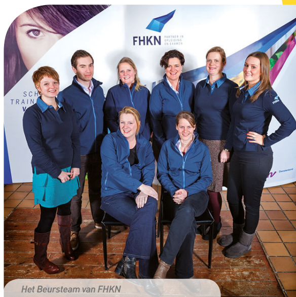
Het Beursteam van FHKN

Samen met branche- en koepelorganisaties ontwikkelen we ook opleidingsmiddelen en ontwikkelingsplannen. Dit alles doen we vooral voor de werknemers in de sector handel. Verkoopmedewerkers in winkels